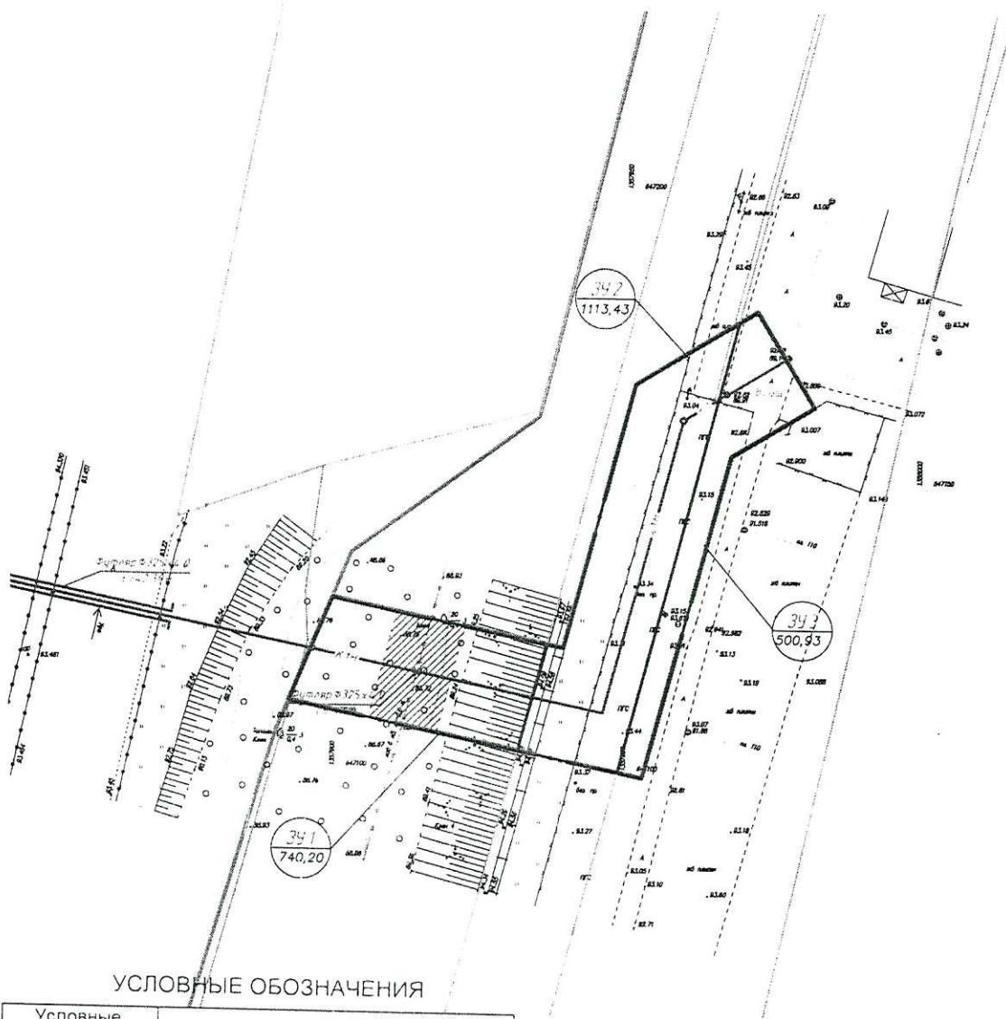
Схема межевания территории, с отображением проектируемых красных линий, границ образуемых земельных участков и объектов капитального строительства