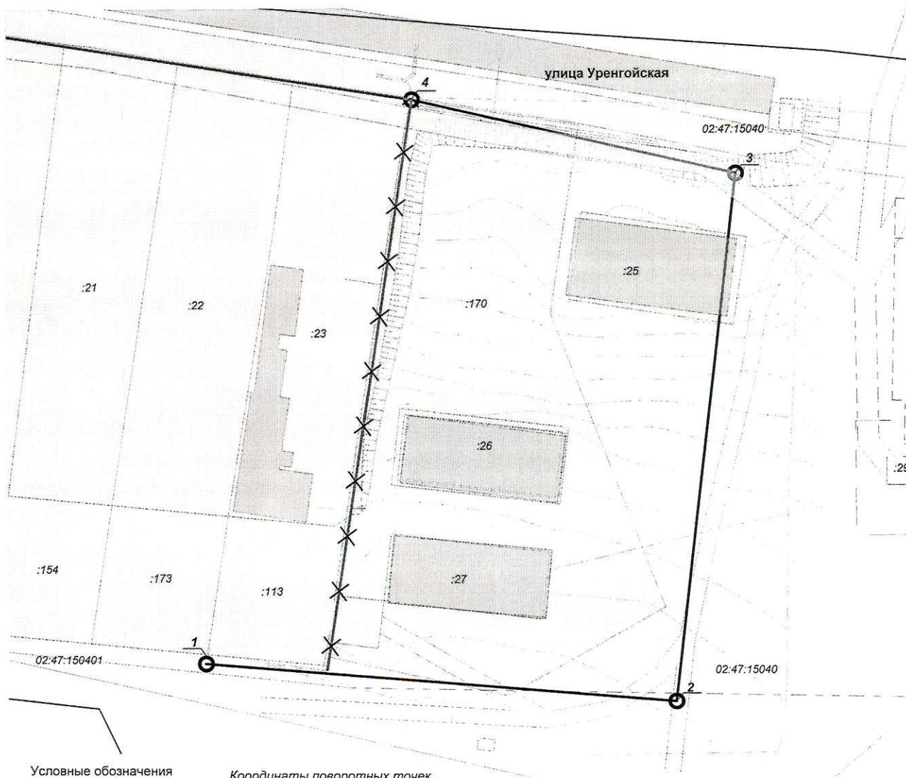
Схема планировки территории, с отображением проектируемых красных линий, границ земельных участков